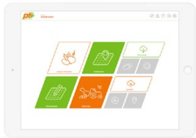
Het dashboard van PT* Online.

Om de toepassing van precisieteelt binnen Precisieteelt Plus nóg gemakkelijker te maken, is PT* Online ontwikkeld. Deze beveiligde omgeving is dé centrale plek om al uw data op een eenvoudige manier te combineren, analyseren en te communiceren. Samen met onze specialisten kunt u hier uw teeltbeslissingen inzien en nieuwe teeltmaatregelen vertalen naar praktische taakkaarten voor uw machines. PT* Online ondersteunt de vijf stappen van Precisieteelt Plus.