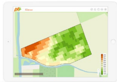
Onder 'taakkaarten' kunt u de gewenste middelen en doseringen in de taakkaart invoeren.

PT* Online toont onze bodempotentiekaarten op uw percelen. U kunt zelf taakkaarten opstellen met een door u gewenste dosering om variabel te poten of zaaien, bemesten of te spuiten. Via de button "Perceelsdata" krijgt u een overzicht van alle data op uw percelen en kunt u zelf waarnemingen toevoegen of locaties in een perceel markeren, die speciale aandacht vereisen, zoals onkruidharder of vraatschade.